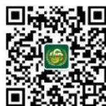
北京金英杰医考课程